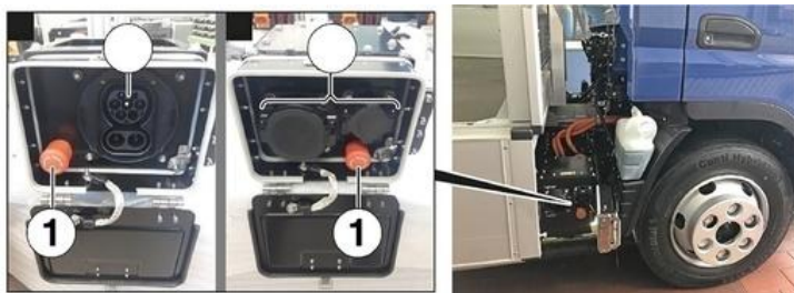
1 Pulsante di disinserimento di emergenza della corrente

Il pulsante di disinserimento di emergenza della corrente si trova sul lato anteriore destro dietro il para-afango dell'asse anteriore.